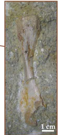
Kość ramienna: coll. T. Krzykawski