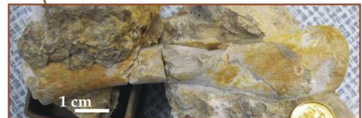
Kość udowa: dar: J. Liszkowski