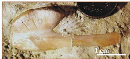
Łopátka: coll. D. Surmik