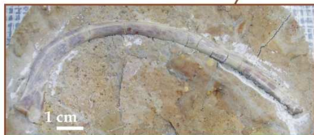
Żebro: coll. T. Krzykawski