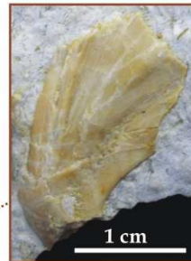
Fragment kości czaszki z okolicy skroniowej: dar: J. Liszkowski