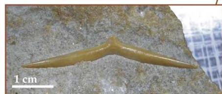
Żebro brzuszne: coll. J. Strzeja