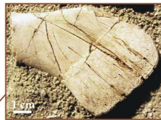
Fragment kości kruczej: coll. T. Krzykawski