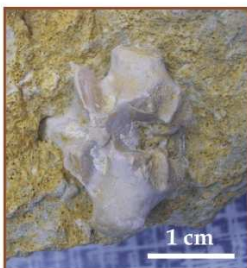
Łuk neuralny kręgu piersiowego: coll. J. Strzeja