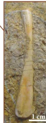
Kość promieniowa: dar: J. Liszkowski