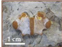
Łuk neuralny kręgu szyjnego: dar: J. Liszkowski